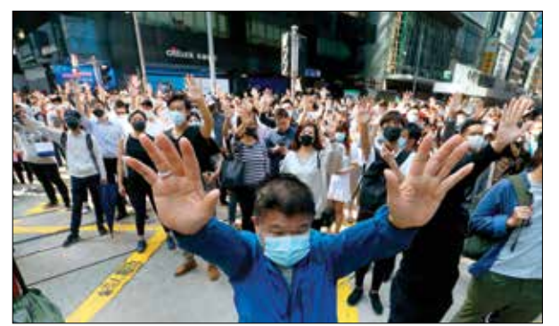
Demonstrators raise their hands during a protest in the financial district in Hong Kong on Friday

The protesters said at a 3 a.m. news conference that the road would be blocked again and warned of other unspecified consequences if the govern-