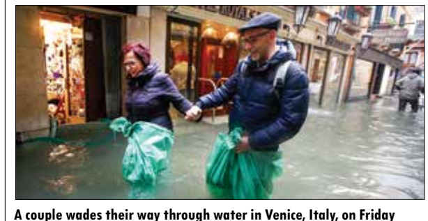
A couple wades their way through water in Venice, Italy, on Friday

VENICE: Venice was inundated by exceptionally high water levels on Friday just days after the lagoon city suffered the worst flood in more than 50 years.