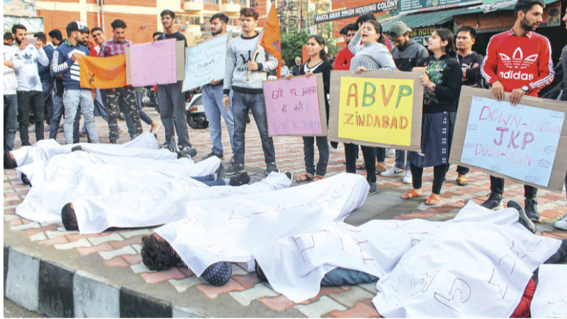
जम्मू में एबीवीपी छात्रों ने अपनी मांगों को लेकर पुलिस महानिरीक्षक कार्यालय के बाहर किया प्रदर्शन।